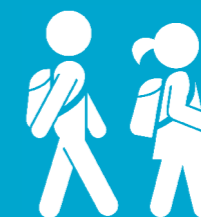
Les collégiens et lycéens