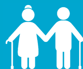
Les personnes âgées