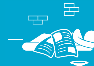
Les personnes en grande précarité ou sans domicile fixe