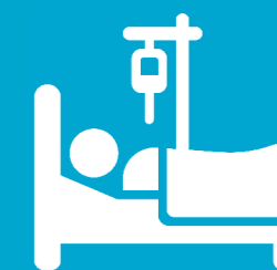
La maladie grave et/ou invalidante et son annonce