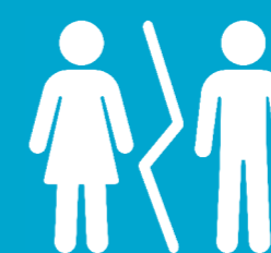
La séparation et annonce de la séparation