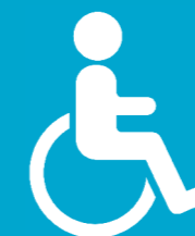
Les personnes en situation de handicap